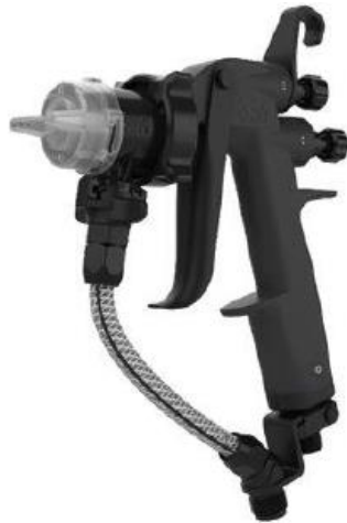
Ejemplo de un latiguillo montado en una pistola de pulverización